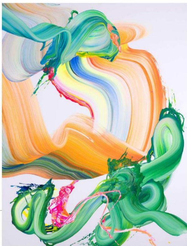
Alex Voinea, "av_836", 200x150 cm. Acrylique sur toile.