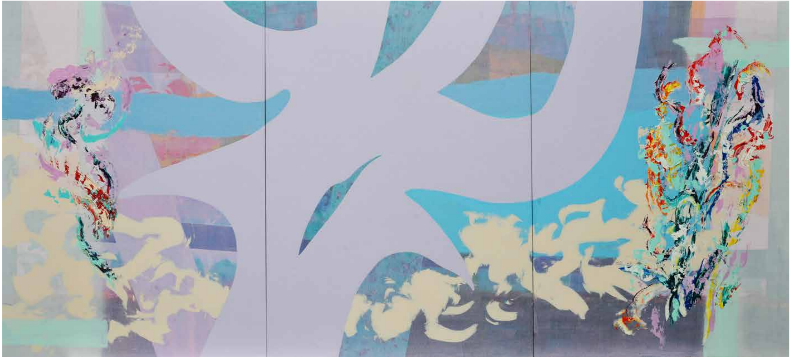
Jacques BAGE 2018 Kalaoa 20/18 Triptych 170 x 375 cm Acrylic on canvas