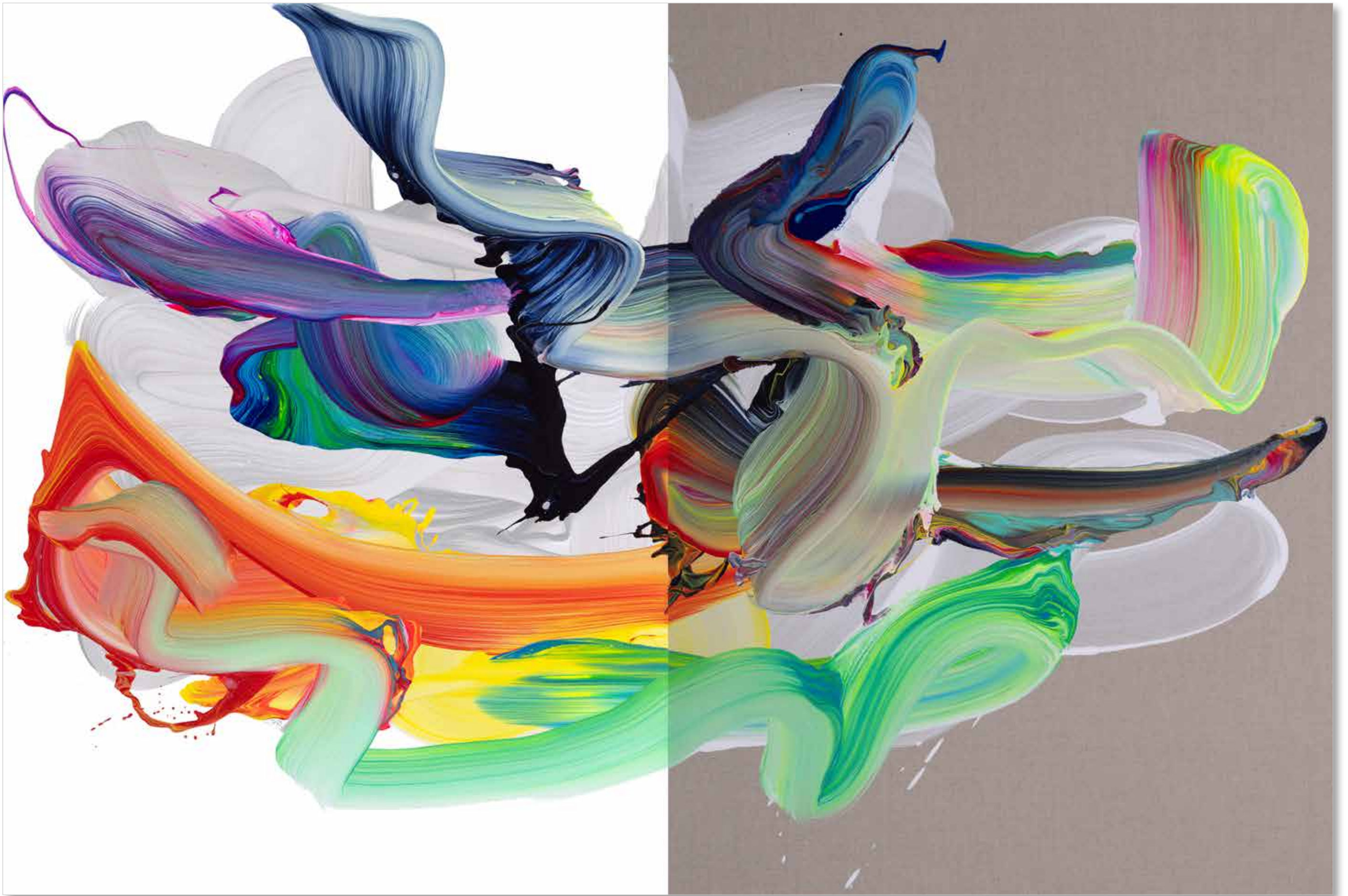
2022 • av_839.1 & 2 (diptych) • 130 x 194 cm • Acrylic on canvas