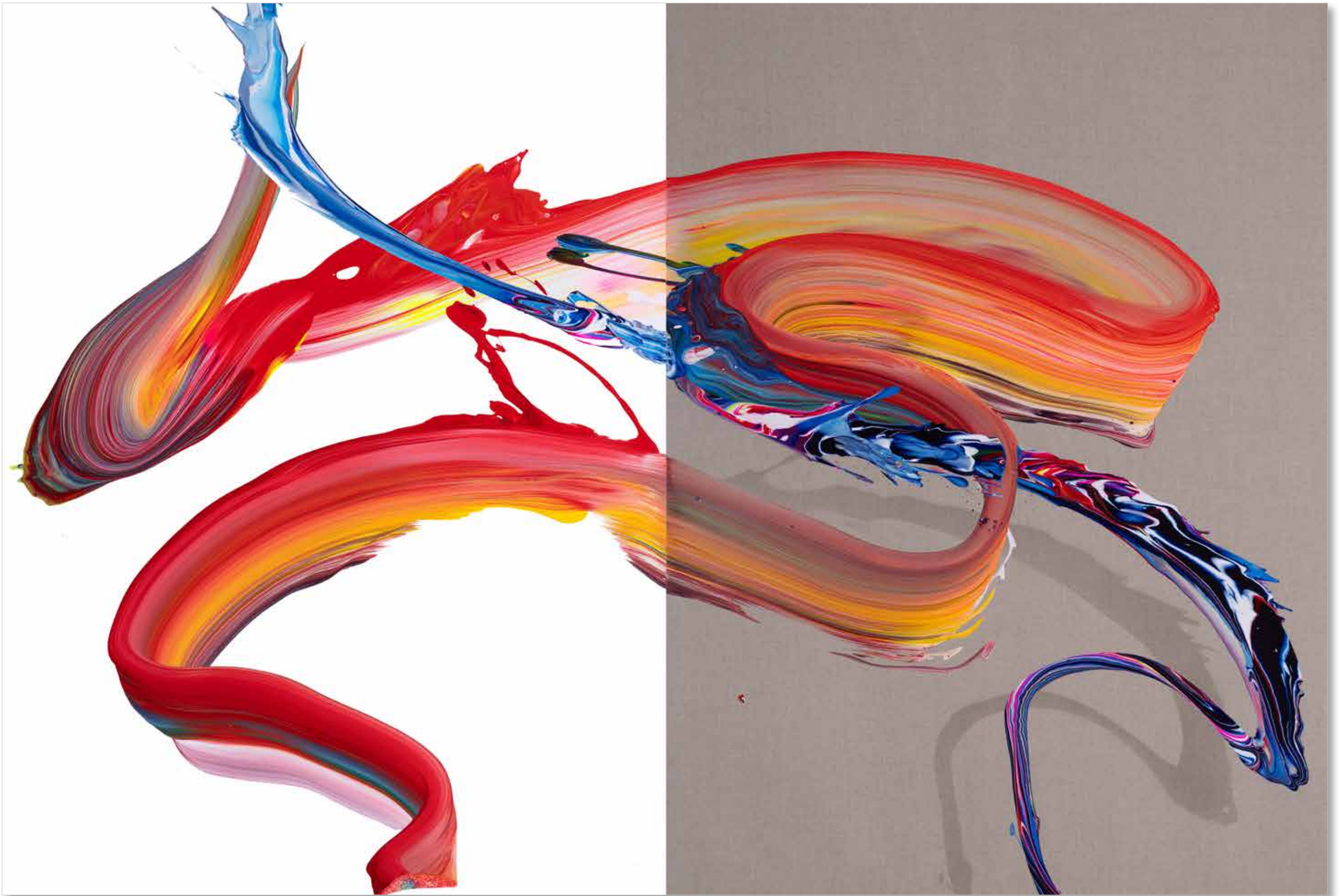
2022 • av_838.1 & 2 (diptich) • 130 x 194 cm • Acrylic on canvas