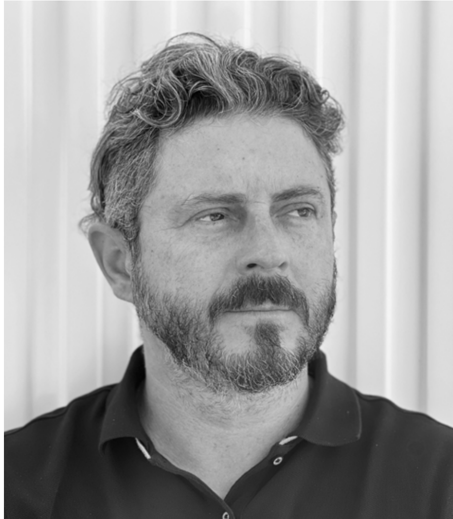
Alex VOINEA • 2022

Pour cette troisième exposition personnelle à la Marc Minjauw Gallery, Alex VOINEA présente des œuvres les plus récentes de différentes séries. Les fonds délavés des précédents travaux ont laissé place à une recherche sur le traitement du support et de la surface des fonds que ce soit par l'utilisation de lin brut (sans la couche de préparation de gesso blanc) ou comme dans sa série "The Underside of White" par le jaillissement de la couleur s'échappant de la sous la couche de gesso blanc.