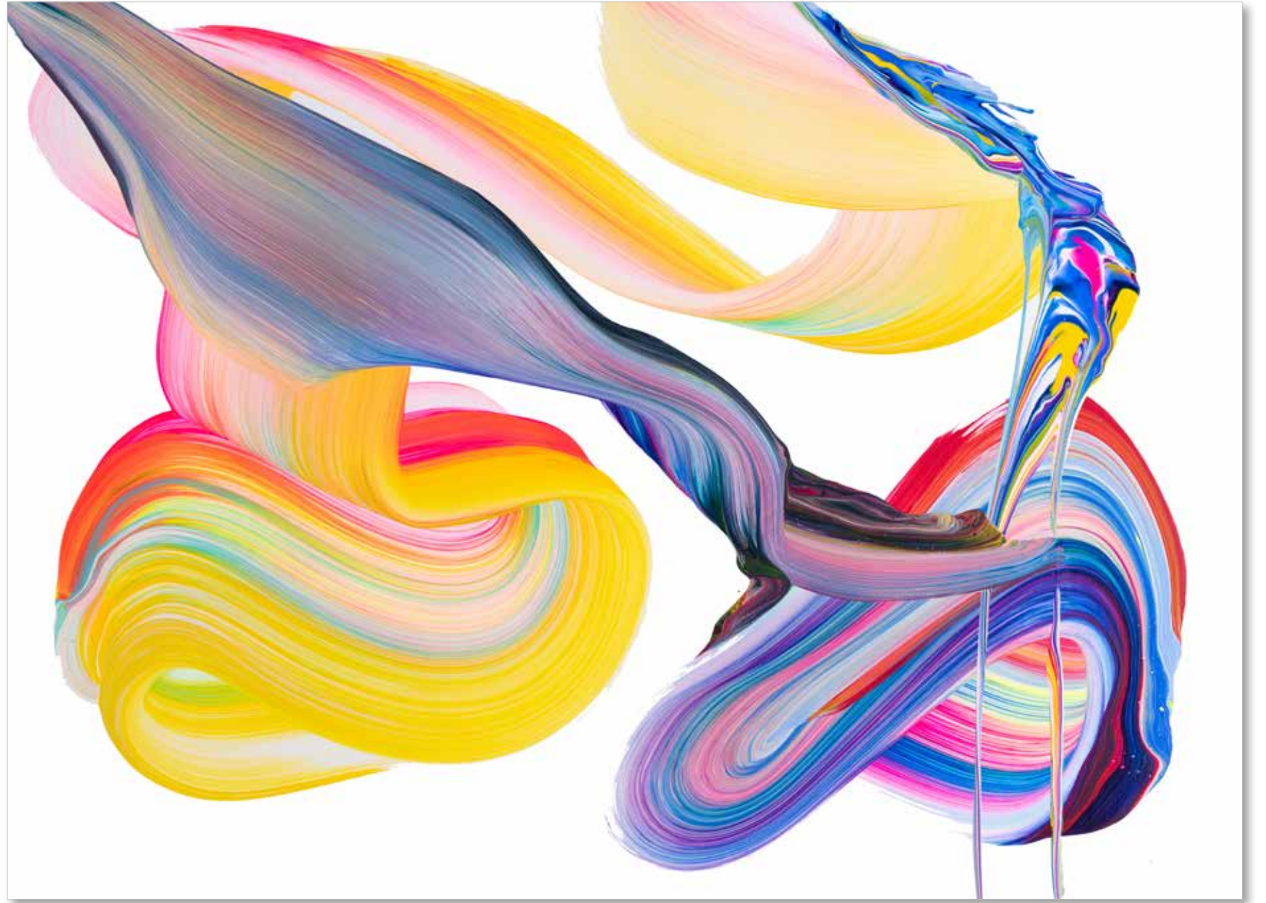
2022 • av_828 • 73 x 100 cm • Acrylic on canvas