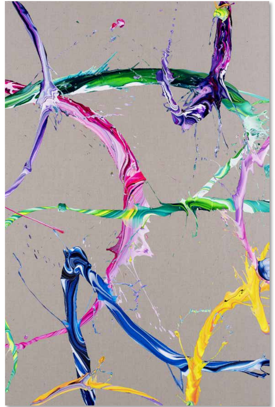
2021 • av_756 • 97 x 146 cm • Acrylic on canvas

In these most recent paintings, the characteristic elements of Voinea's previous work, such as big brushstrokes, splashes and drippings have evolved from a contention for prominence and have begun to intertwine. His interest is focused on the interaction and connection of these different elements and it is even more evident in this new exhibit entitled 3 Seconds After Lift Off . In these new works an additional element has materialized and has joined in the search for prominence. As a natural result of the commingling of all of these various elements on the canvas, shadows now appear. A new dimension has been created; a new perspective just as the paint begins to rise up and levitate above the canvas. Perhaps this levitation at heart is a prequel to Alex's previous work and particularly the series, Learning to Fly , since any attempt to fly must first begin with an attempt to lift off or rise up from the surface.