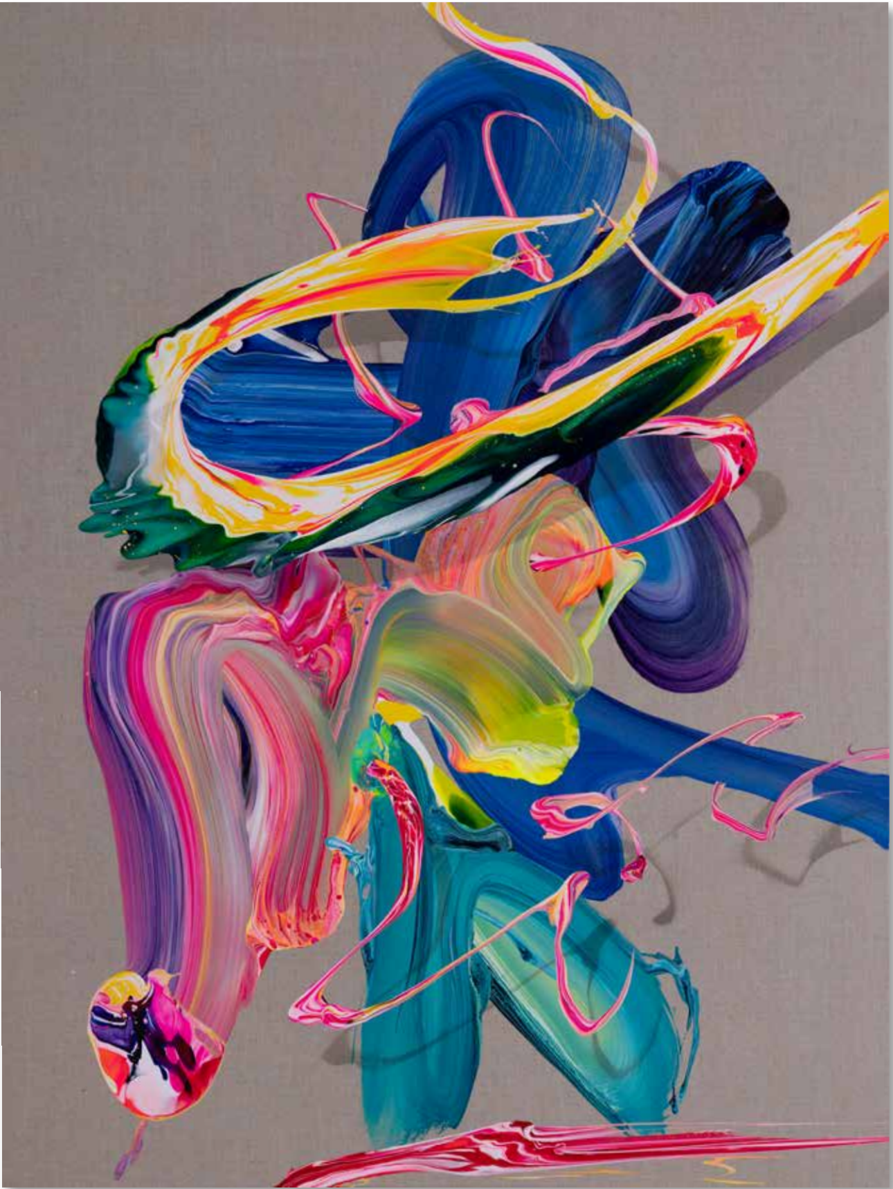
2022 • av_833 • 130 x 97 cm • Acrylic on canvas