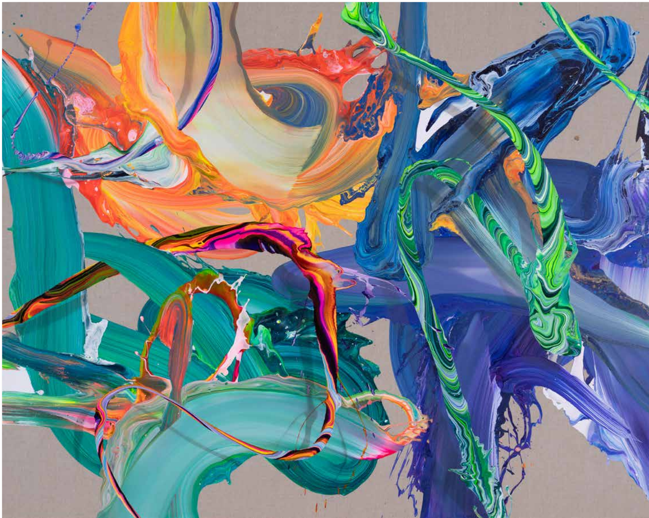
2022 • av_814 • 120 x 151 cm • Acrylic on canvas