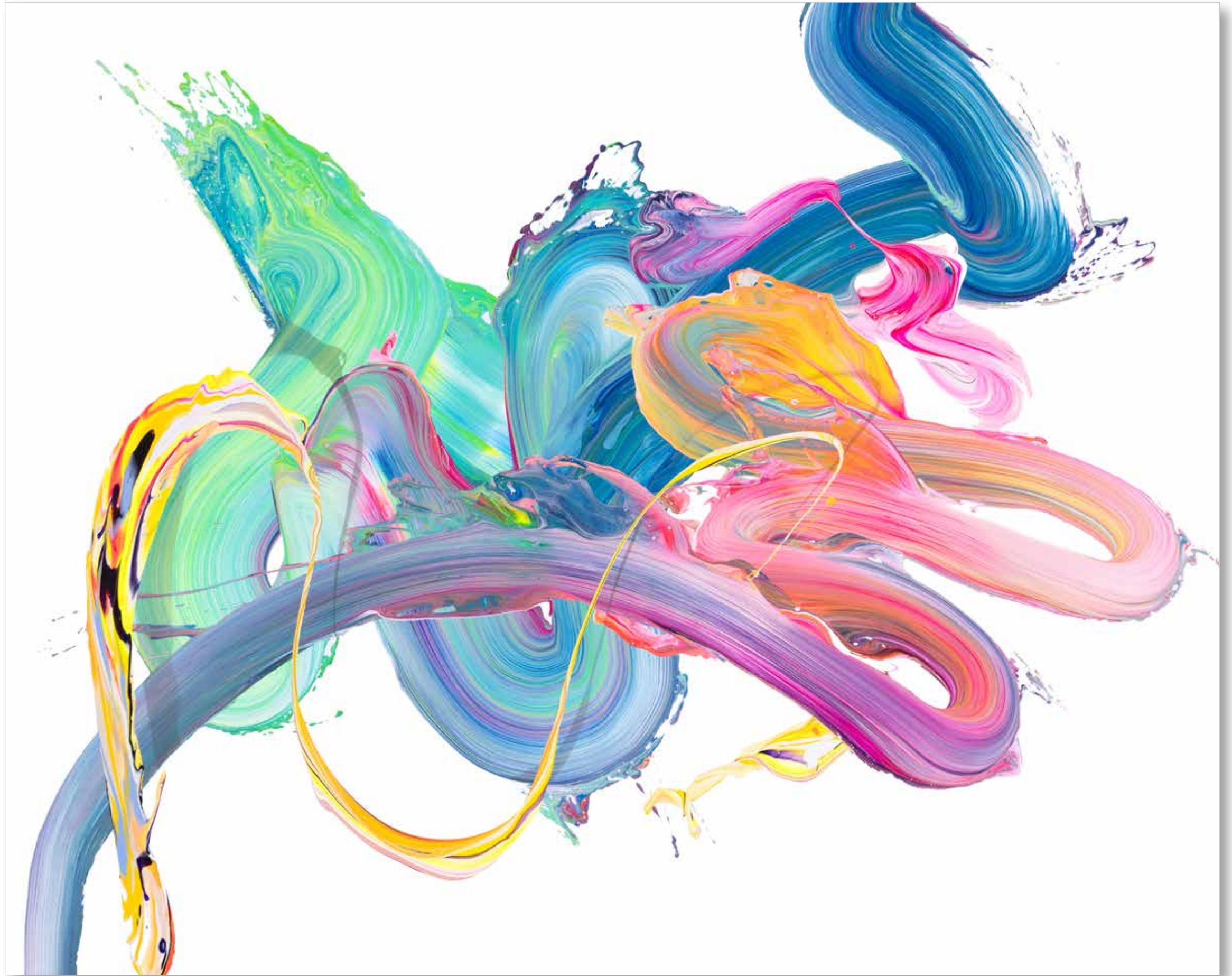
2022 • av_832 • 130 x 162 cm • Acrylic on canvas