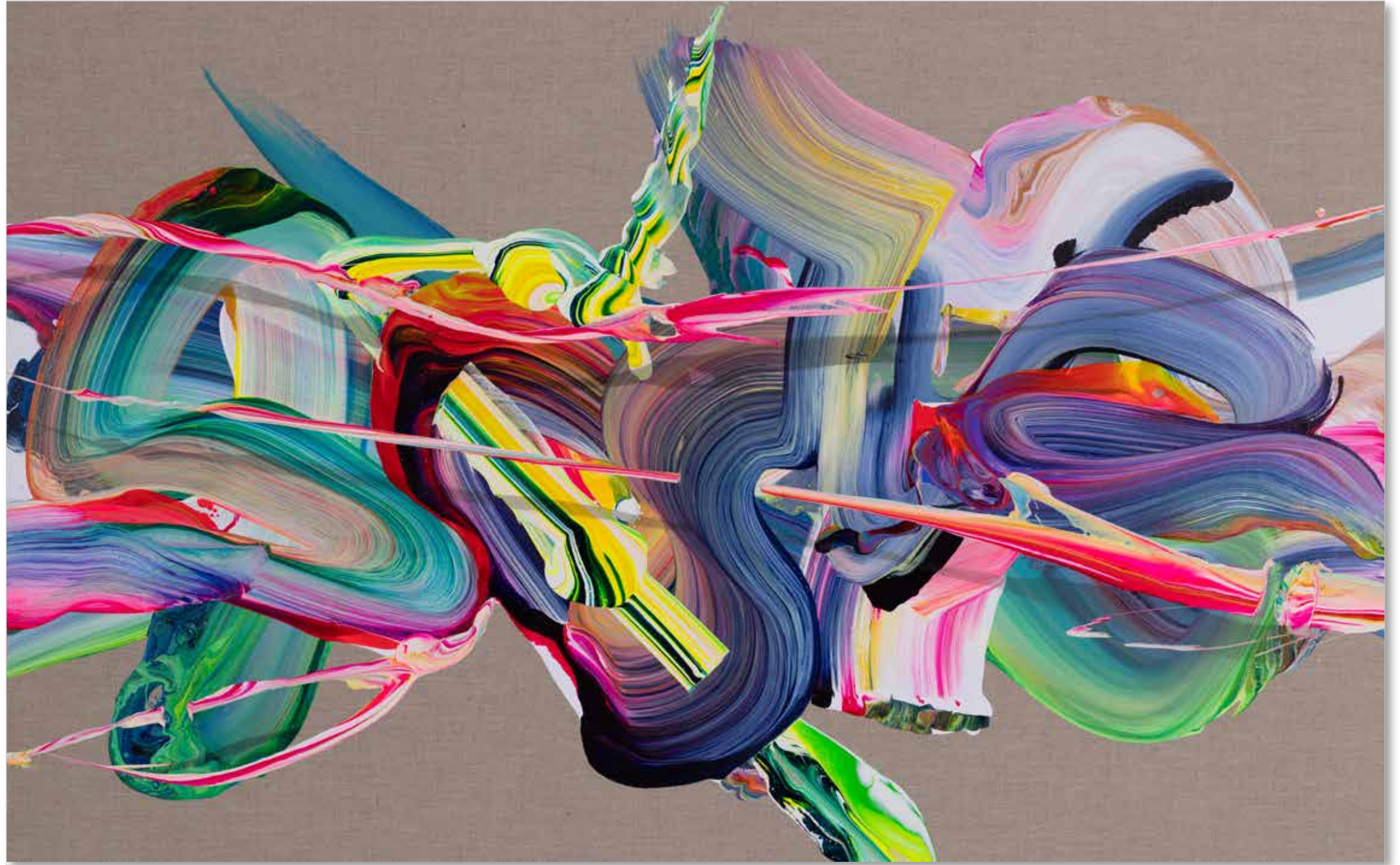
2022 • av_837 • 73 x 116 cm • Acrylic on canvas