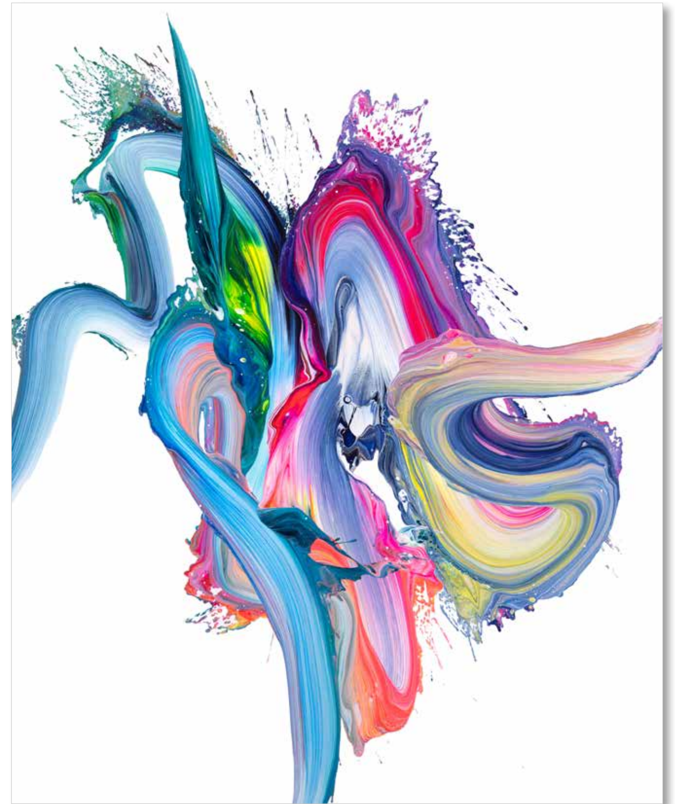
2022 • av_834 • 130 x 162 cm • Acrylic on canvas