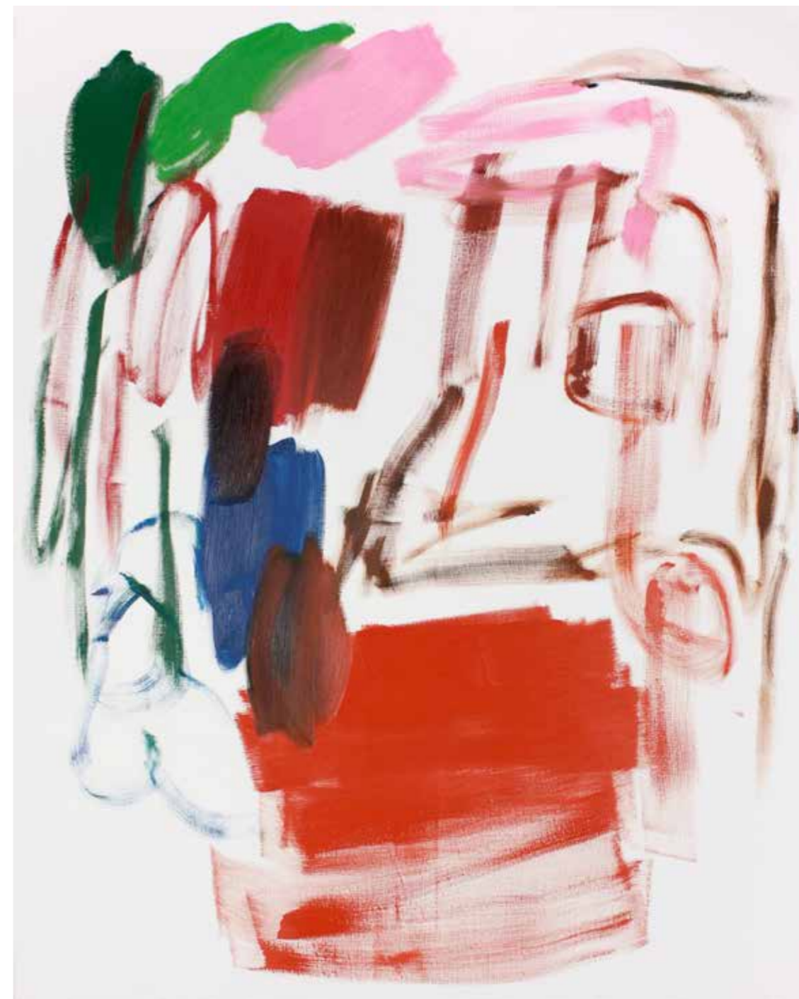
BPPB 03072018 Oil on canvas 162 x 130 cm