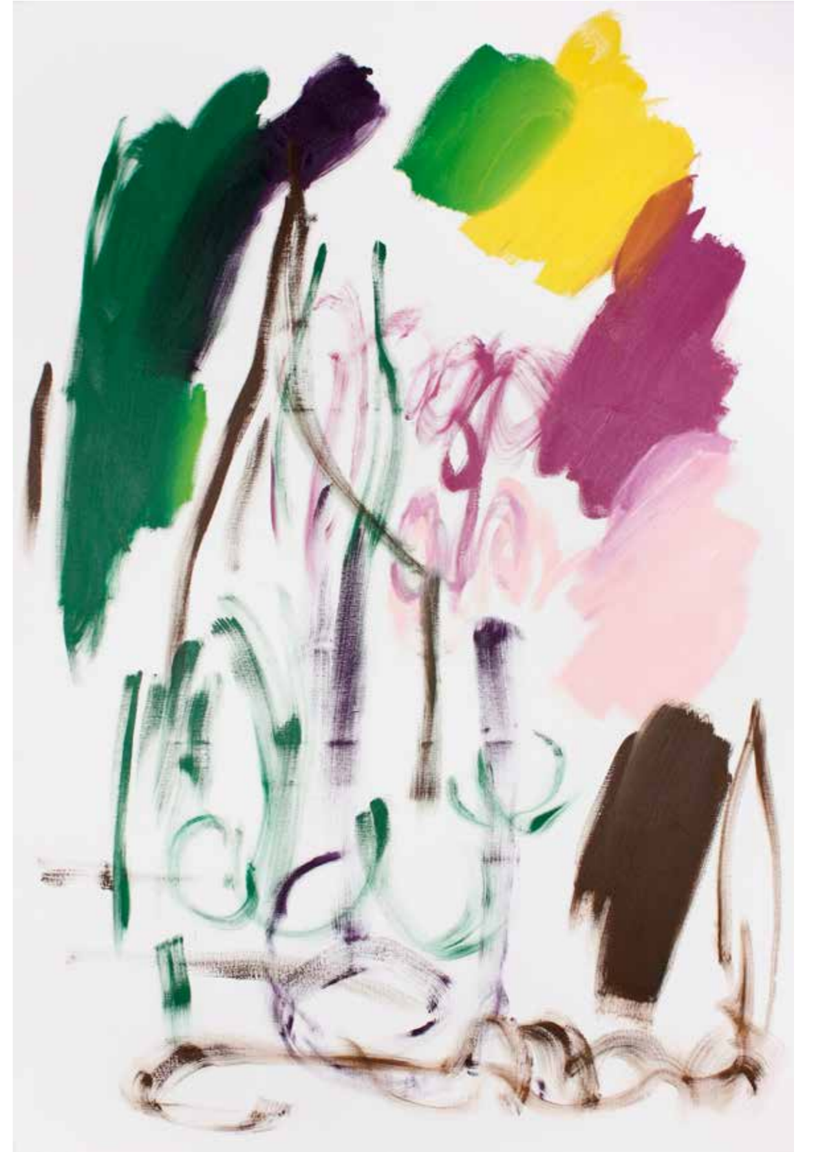
BPPB 02072018 Oil on canvas 195 x 130 cm