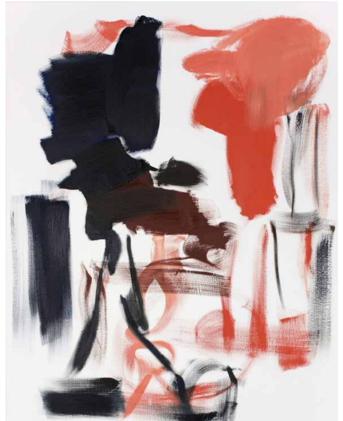
BPPB 01072018 Oil on canvas 146 x 114 cm