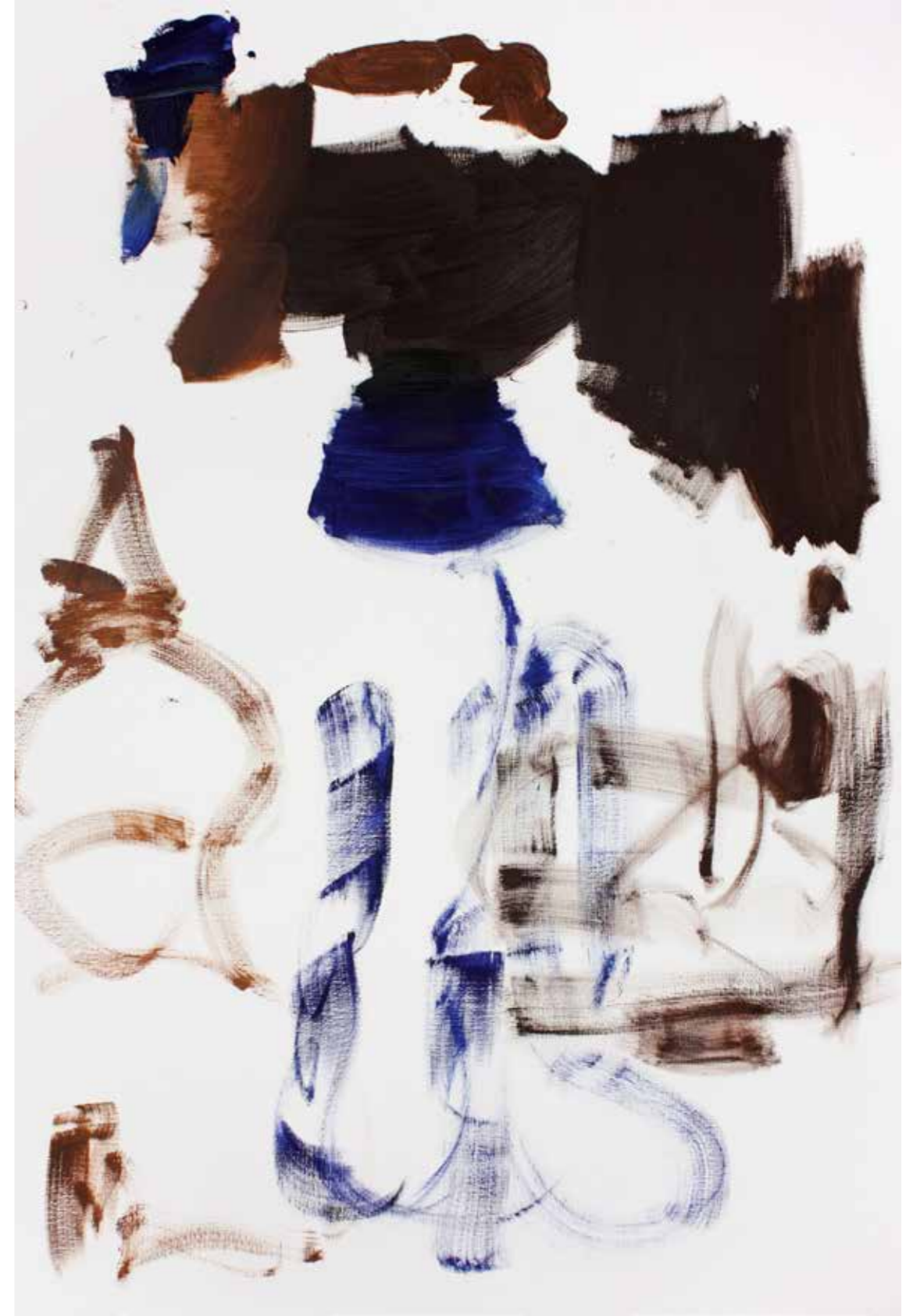
BPPB 13052018 Oil on canvas 195 x 130 cm