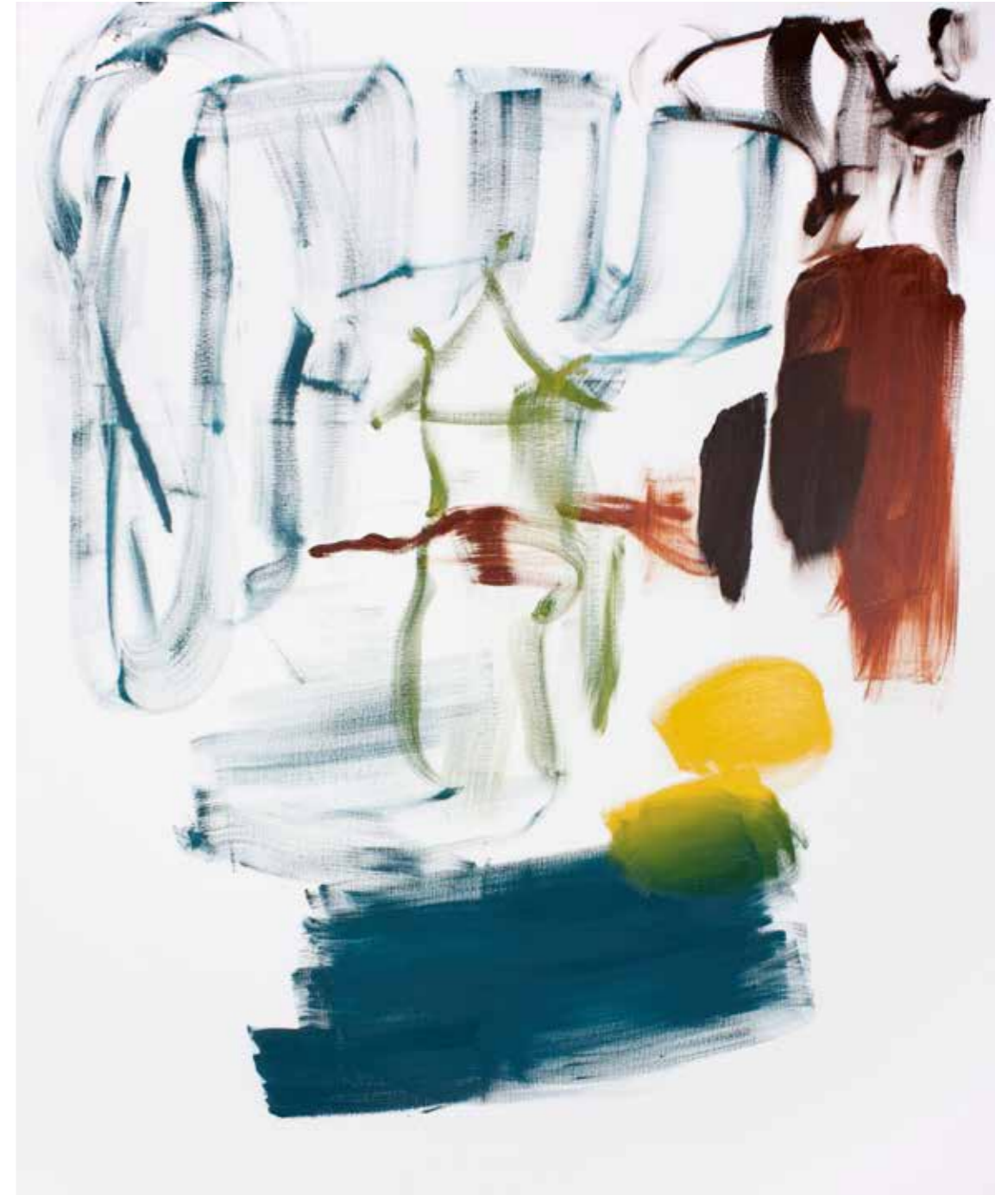
BPPB 05052018 Oil on canvas 200 x 160 cm