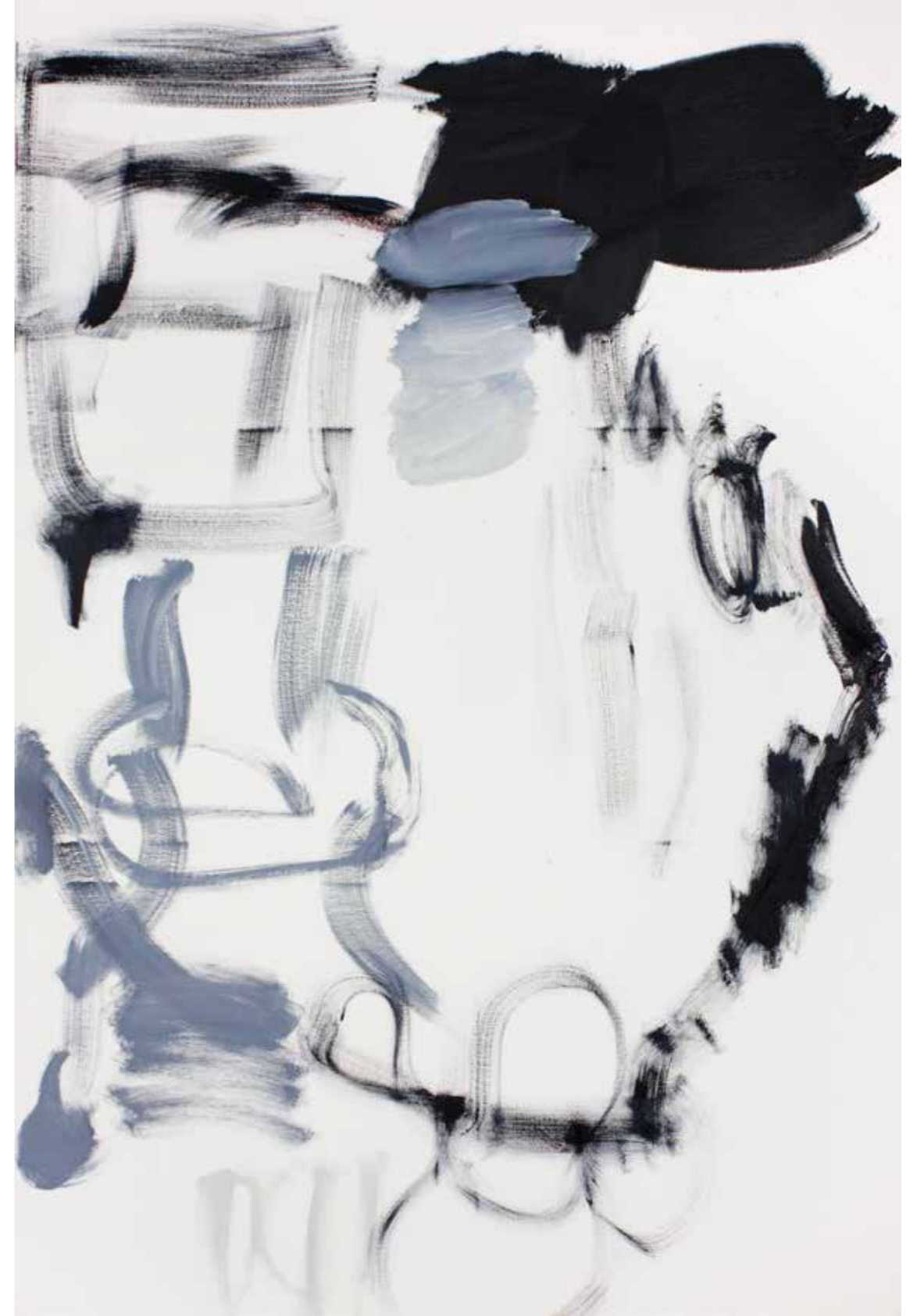
BPPB 04032018 Oil on canvas 195 x 130 cm