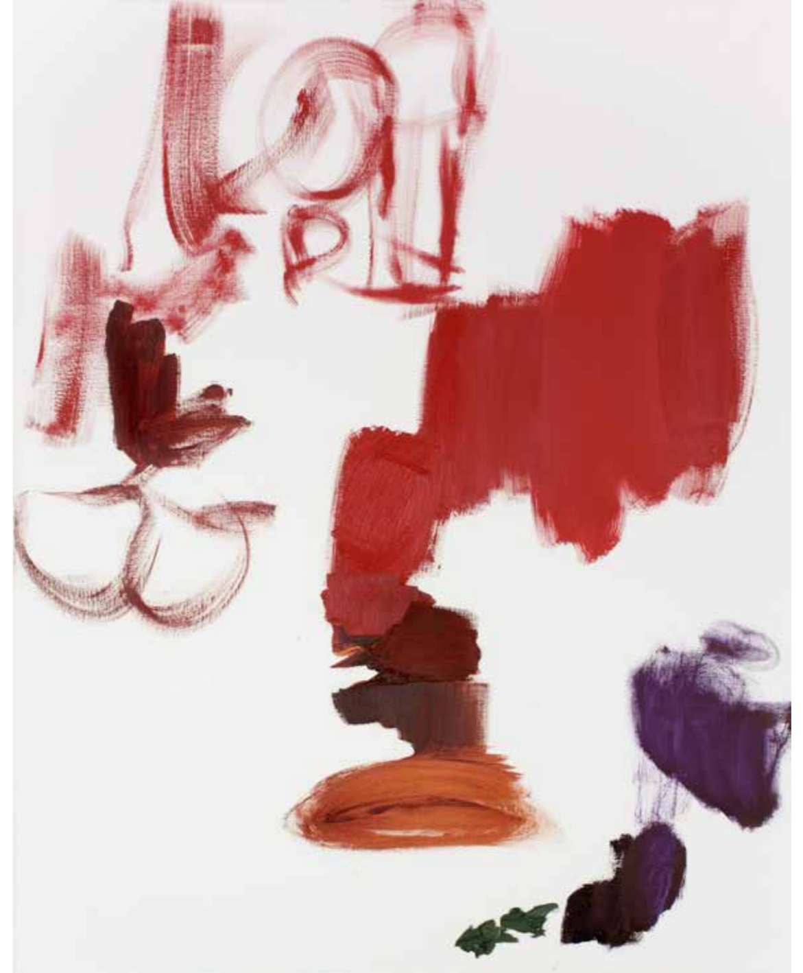
BPPB 10022018 Oil on canvas 146 x 114 cm