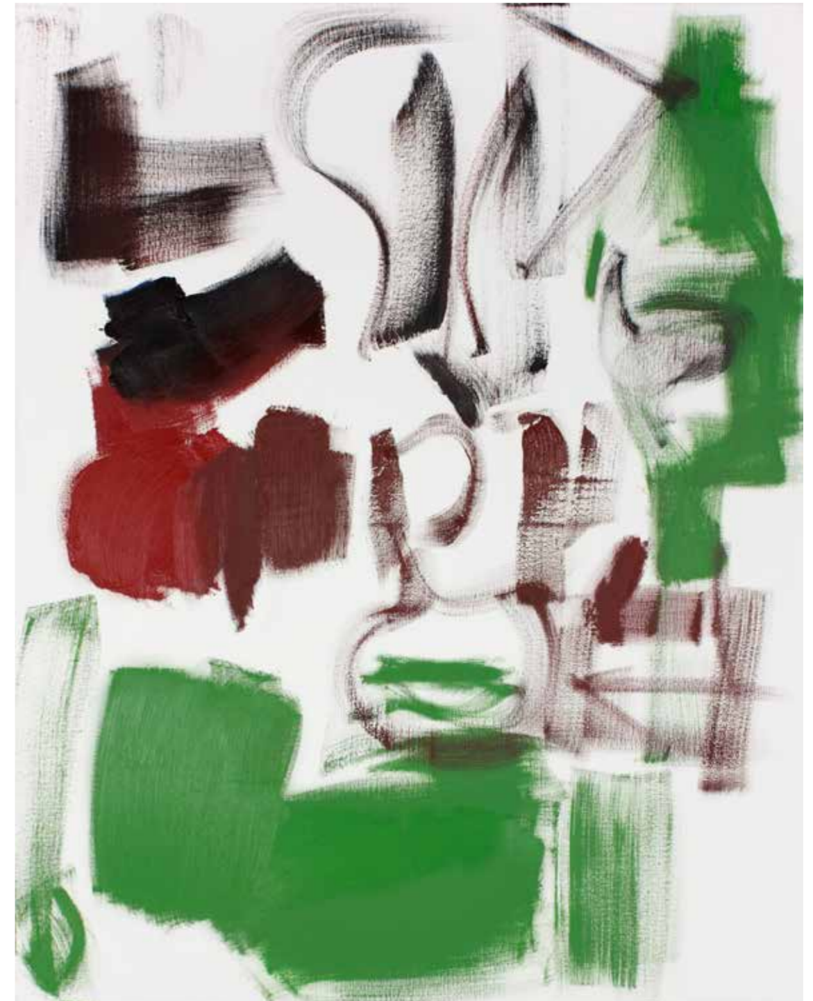
BPPB 18062018 Oil on canvas 146 x 114 cm