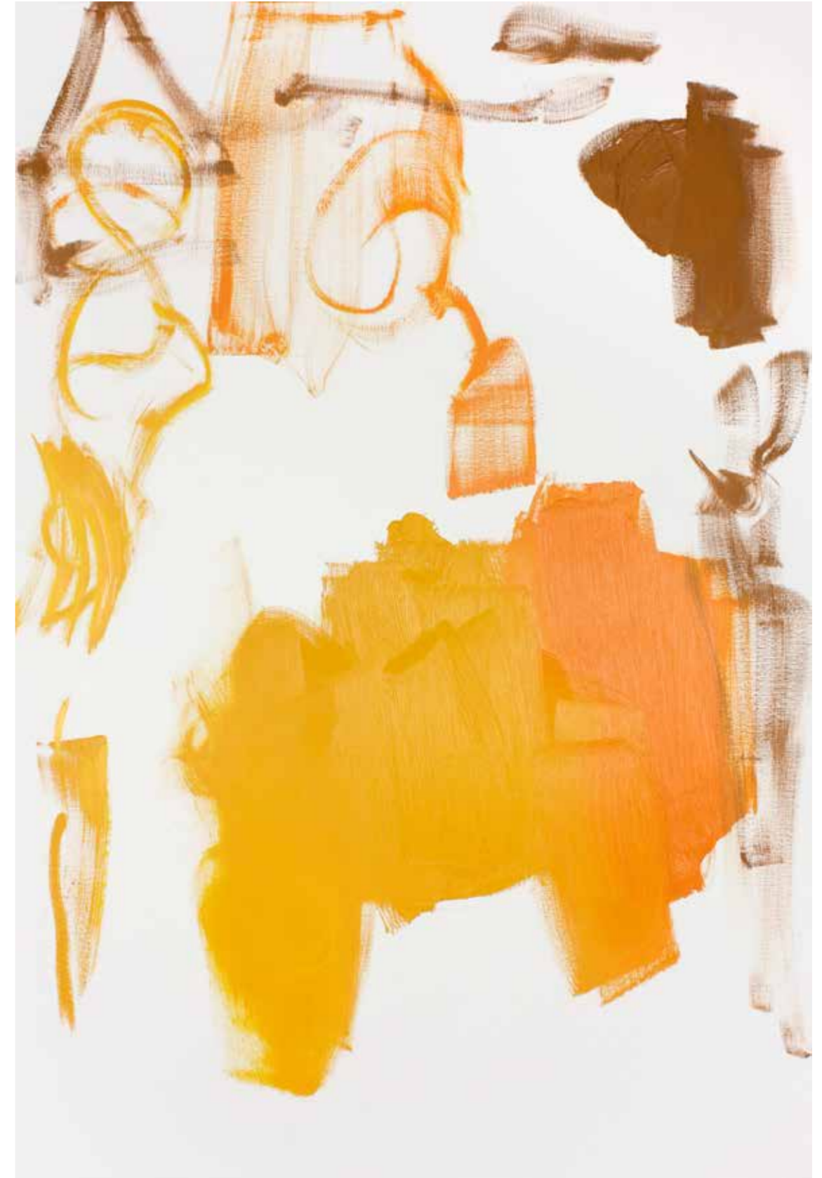
BPPB 25062018 Oil on canvas 195 x 130 cm