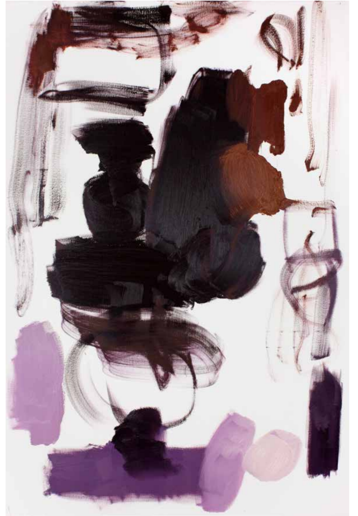
BPPB 21052018 Oil on canvas 195 x 130 cm