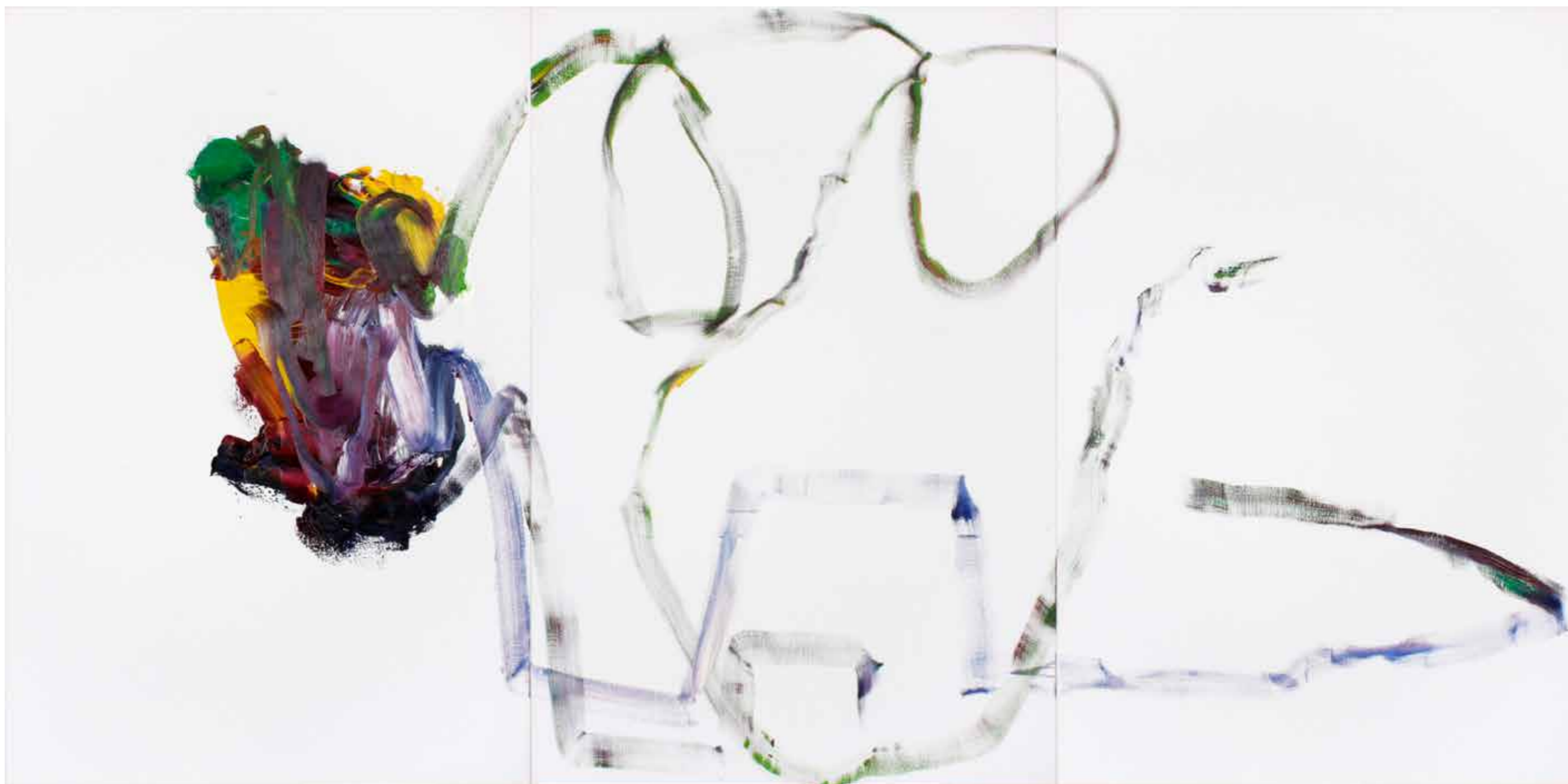
BPPB t56, triptych Oil on canvas 195 x 390 cm