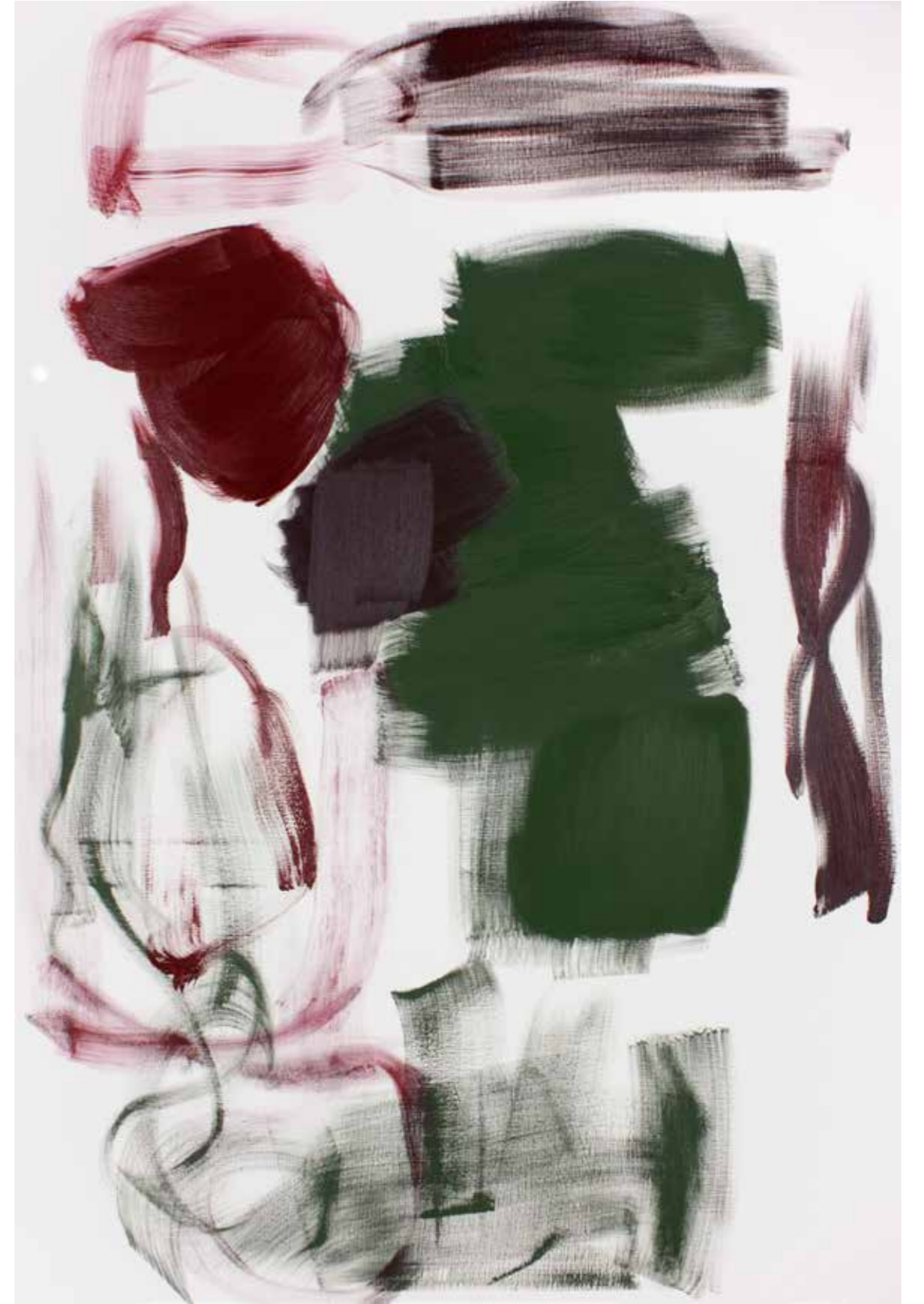
BPPB 09052018 Oil on canvas 195 x 130 cm