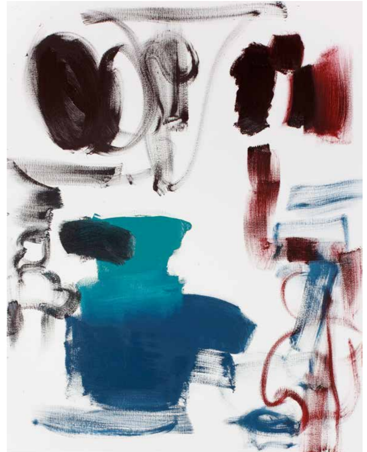
BPPB 15032018 Oil on canvas 146 x 114 cm