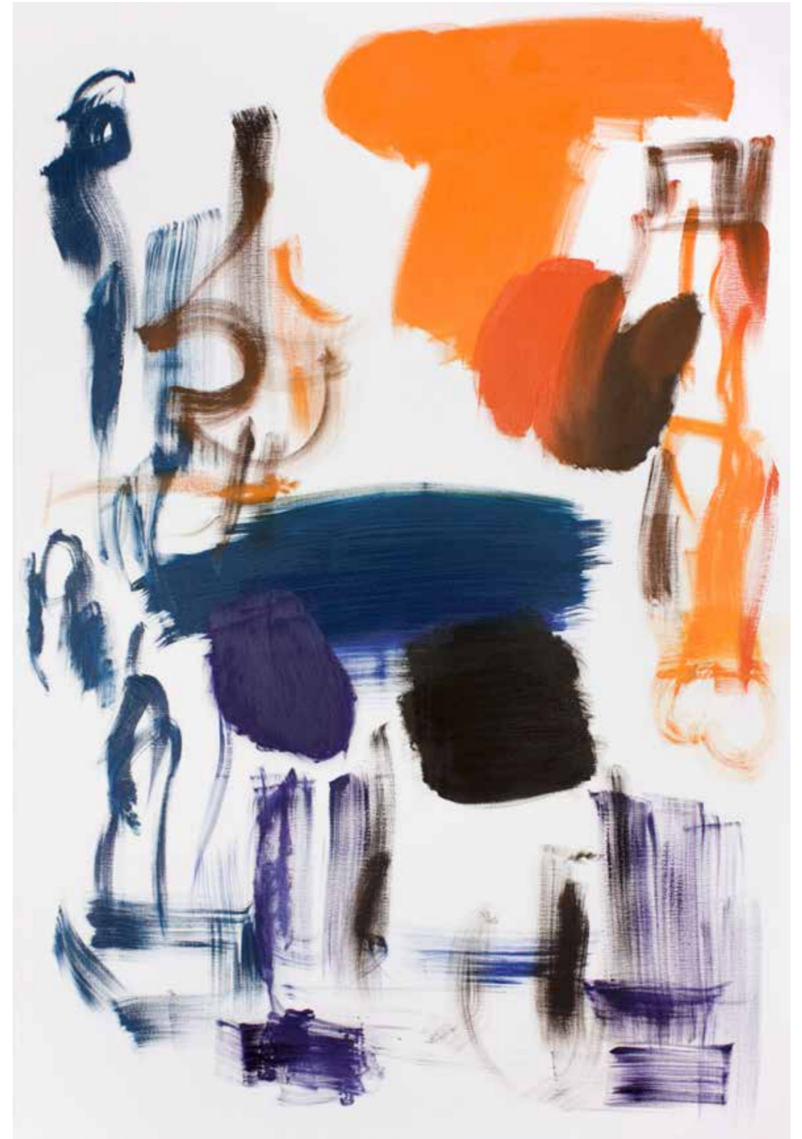
BPPB 10062018 Oil on canvas 195 x 130 cm